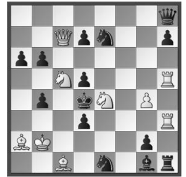
Nr. 1: Michael Schneider, Wehrmacht – Heimat, Die Schwalbe 1944, 2. ehrende Erwähnung

Zuerst die Thematische Fehlversuche : 1.Da8? (mit der Drohung 2.Dxd5#), 1.--Te4 2.Da7#, 1.--e4 2.Dxh8#, aber 1.--Ke4! auch 1.Dd8? (droht 2.Dxd5#), 1.--Te4 2.Db6#, 1.--e4 2.Dxh8#, aber 1.--Ke4!. es löst 1.De6! (droht 2.Dxd5#), 1.--Te4 2.Db6#, 1.--e4 2.dxc3#, 1.--dxc4 2.Dxc4# und noch 1.--Ke4 2.Txf4#. Alle Verteidigungszüge spielen sich auf dem Themafeld d5 ab. Somit haben wir das » Bartolovic «-Thema.